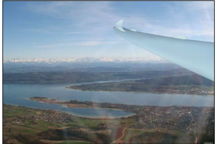
Untersee mit den Alpen im Hintergrund