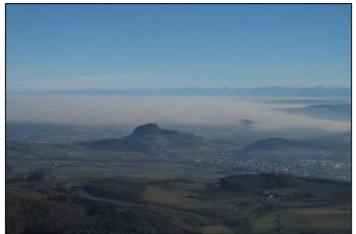
Der Hohentwiel mit Alpen