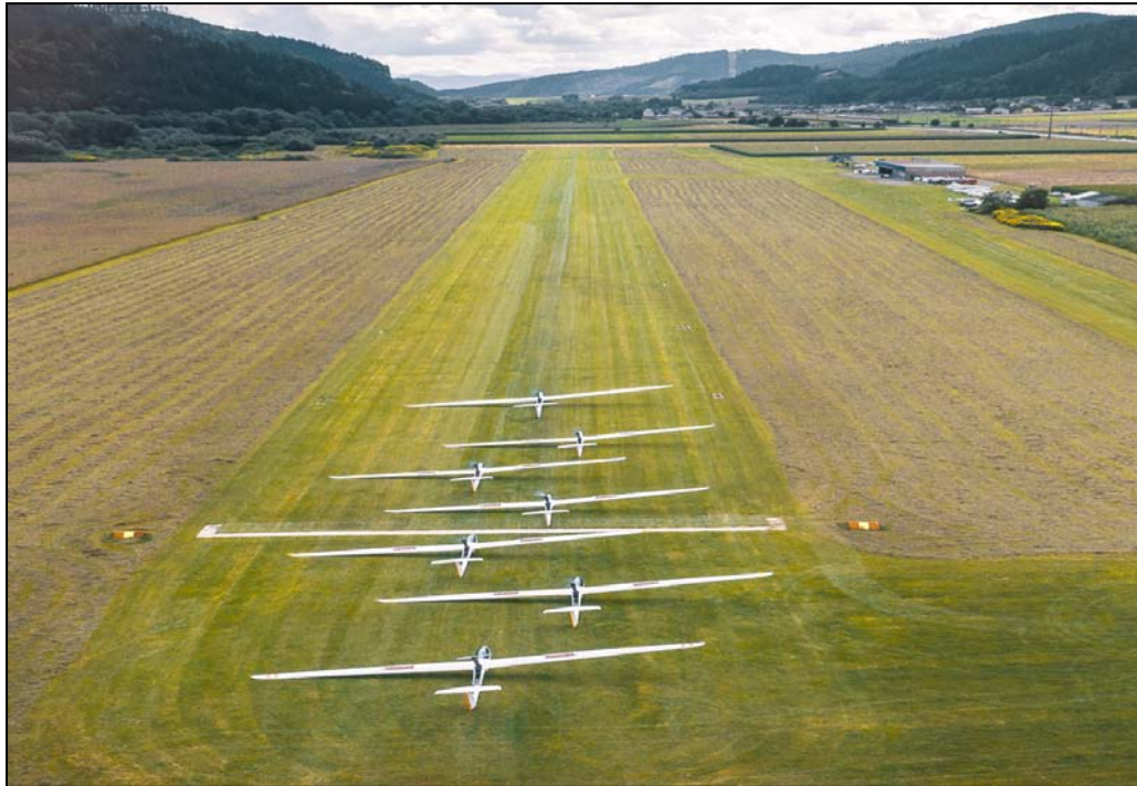
Shark-Treffen 2019 in Friesach Hirt