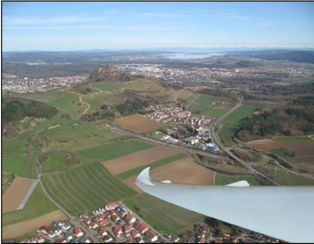
Der Hausberg von Singen – der Hohentwiel