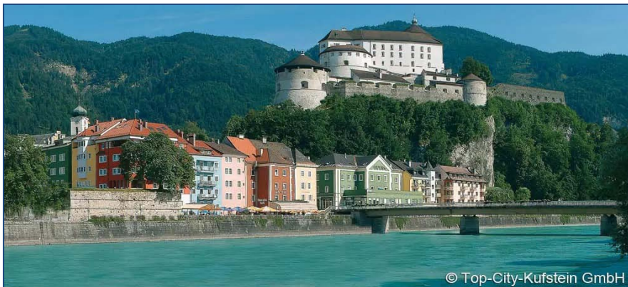
Das Unterinntal – Blick vom Hafelekar (Nordkette bei Innsbruck) Richtung Südosten und die Festung Kufstein

https://www.tirol.at/reisefuehrer/ausflugstipps?qclid=EAlaIqobChMIhrPrgLLr8wIVSwOLChObhgD7EAAAYASAAEqKgvD_BwE