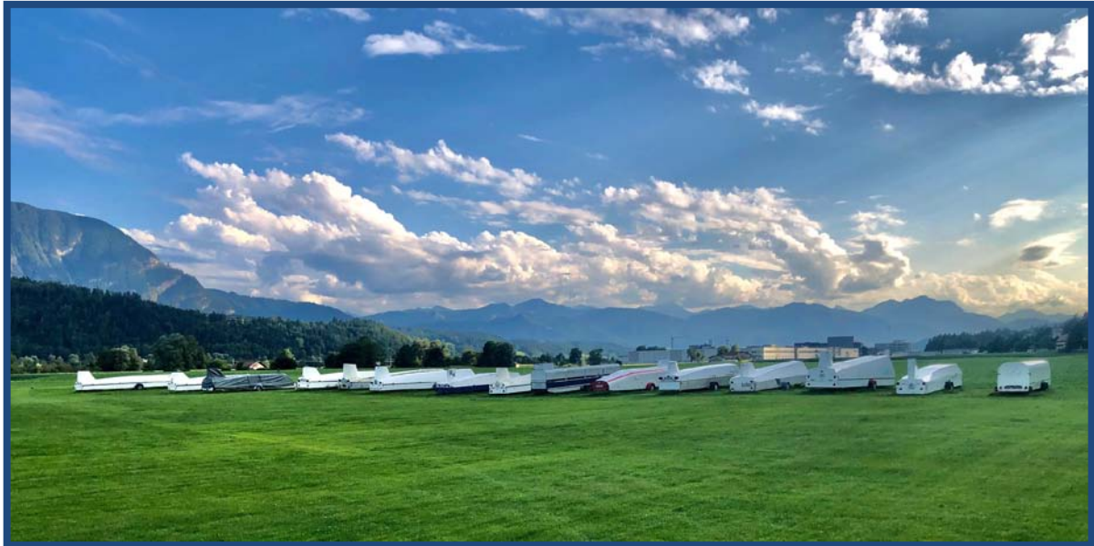
KUFSTEIN – LANGKAMPFEN im Spätsommer