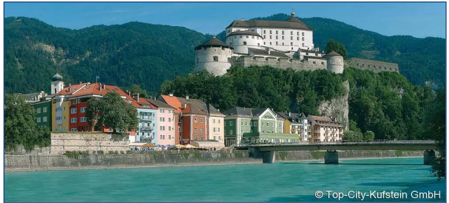
Das Unterinntal – Blick vom Hafelekar (Nordkette bei Innsbruck) Richtung Südosten und die Festung Kufstein

https://www.tirol.at/reisefuehrer/ausflugstipps?qclid=EA1a1QobChMIhrPrqLLr8wIVSwOLChObhgD7EAAYASAAEqKgkvD_BwE